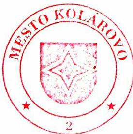
Ārpád Horváth primátor mesta